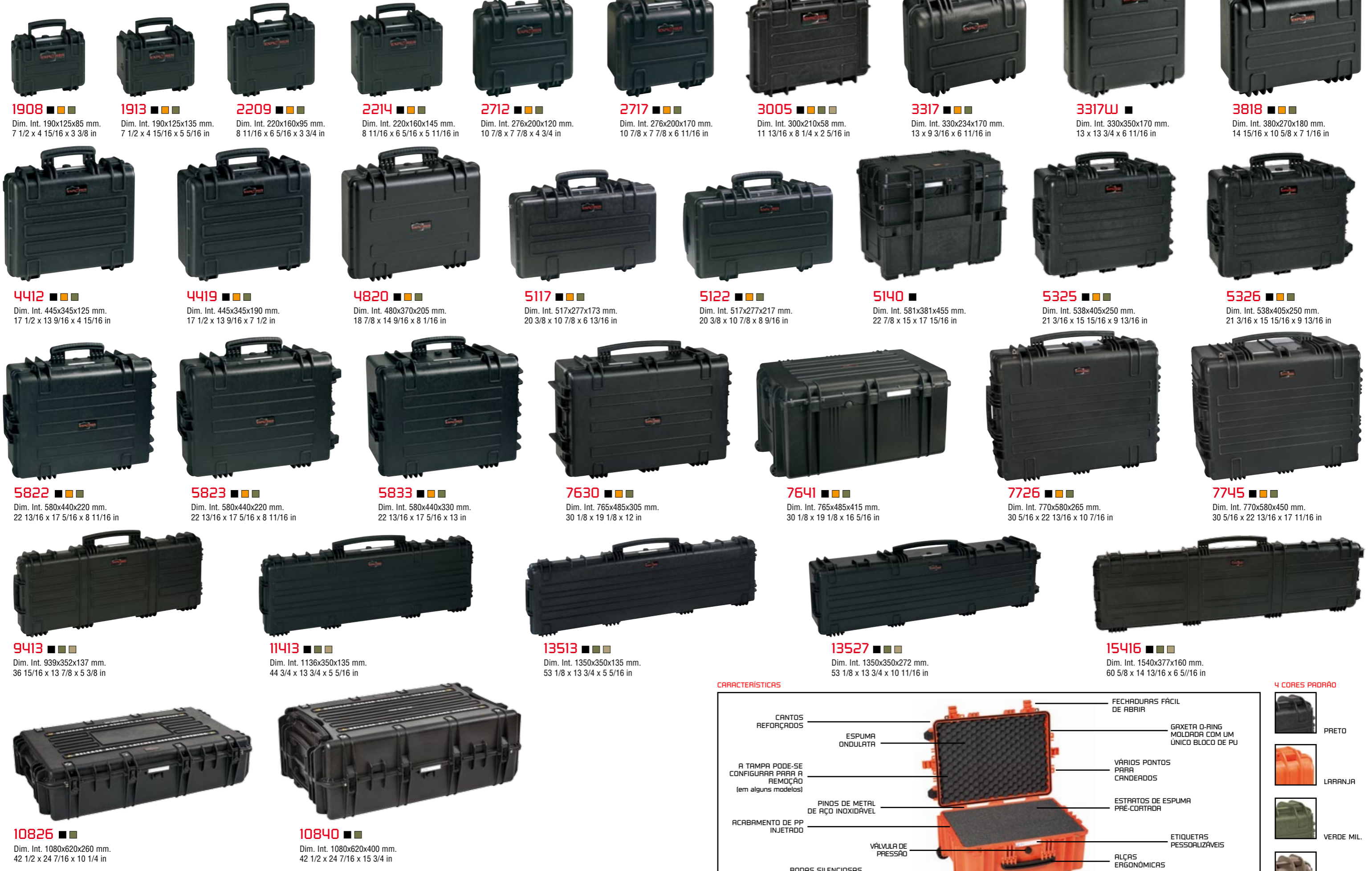
1908 ■■■ Dim. Int. 190x125x85 mm. 7 1/2 x 4 15/16 x 3 3/8 in 1913 ■■■ Dim. Int. 190x125x135 mm. 7 1/2 x 4 15/16 x 5 5/16 in 2209 ■■■ Dim. Int. 220x160x95 mm. 8 11/16 x 6 5/16 x 3 3/4 in 2214 ■■■ Dim. Int. 220x160x145 mm. 8 11/16 x 6 5/16 x 5 11/16 in 2712 ■■■ Dim. Int. 276x200x120 mm. 10 7/8 x 7 7/8 x 4 3/4 in 2717 ■■■ Dim. Int. 276x200x170 mm. 10 7/8 x 7 7/8 x 6 11/16 in 3005 ■■■ Dim. Int. 300x210x58 mm. 11 13/16 x 8 1/4 x 2 5/16 in 3317 ■■■ Dim. Int. 330x234x170 mm. 13 x 9 3/16 x 6 11/16 in 3317W ■■■ Dim. Int. 330x350x170 mm. 13 x 13 3/4 x 6 11/16 in 3818 ■■■ Dim. Int. 380x270x180 mm. 14 15/16 x 10 5/8 x 7 1/16 in